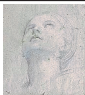
Domenichino, Kopfstudie für das Kuppelfresko der hl. Cäcilia in der Capella Farnesiana der Abtei von Grottaferata, 1608–10