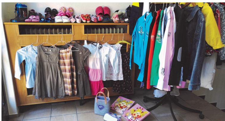
Caritas Boutique in Vorst

Kleiderstube für Alle von 0-99 Jahren. Zur Zeit finden Sie bei uns auch Kinderwagen mit vollständigem Zubehör, Baby- und Kleinkinderausstattung, Kinderreisebett, hochwertigen Schulrucksack, Kinder- Handballausstattung, lustige Taschenbücher